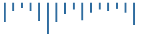
Graf 1 - podíl obyvatel ČR v obcích dle pásem velikosti obcí